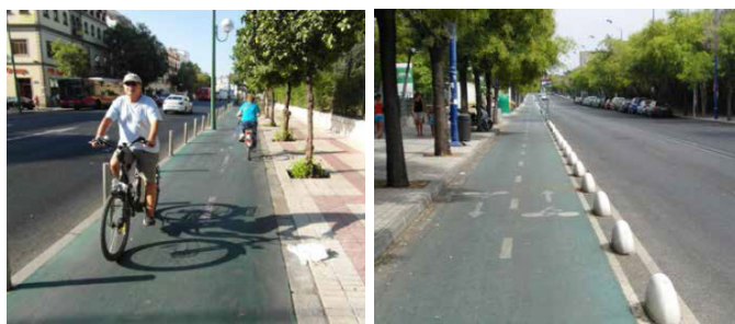
Vývýšený cyklistický pruh v Utrechtu a ve Stockholmu