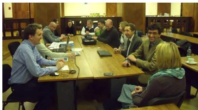
Foto: Jednání Valné hromady CIVINETu ČR a SR, Praha, 30. 3. 2015

směřování a rozvoje. Řídící rada CIVINETu pak v souladu se stanovami schválila přijetí nových členů CIVINETu. Víťame v našich řadách statutární města České Budějovice, Zlín, Přerov a město Třinec. Noví přidružení členové jsou Nadace Partnerství, Asociace měst pro cyklisty, Výzkumné centrum Žilinskej univerzity, ROPID a Dopravný podnik mesta Košice, a.s.