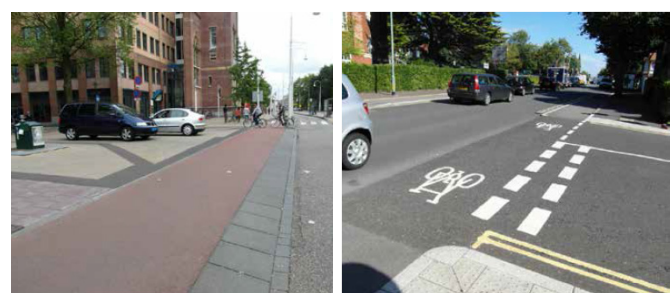
Utrecht: Cyklostezka má prioritu v křižovatce před vedlejší ulicí, jak je zdůrazněno červeným asfaltem; Brighton a Hove: značení u křižení cyklostezky s vedlejší ulicí

Autoři studie zdůrazňují, že dobré podmínky pro cyklistiku, a z toho vyplývající vyšší podíly cyklistické dopravy, jsou možné jen tam, kde politici a dopravní odborníci souhlasí, že zvyšování podílů cyklistické dopravy je pro město přínosné z ekonomických, sociálních a environmentálních důvodů. Jednotné plánování města k podpoře cyklistiky vede ke konkrétním aktivitám na několika „frontách“ současně, podle jasné dlouhodobé vize. Důležitá je kontinuita a dlouhodobý proces.