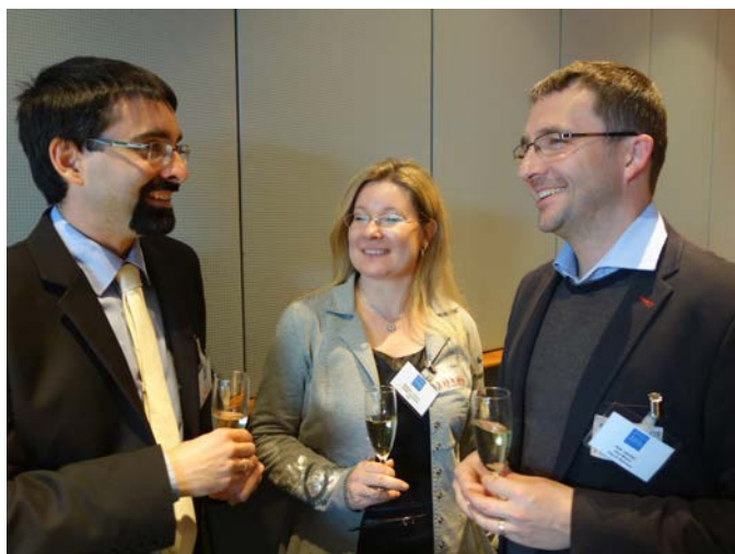
Foto: Zástupci české a maďarské delegace na neformálním jednání v Evropském parlamentu 13. 4. 2015