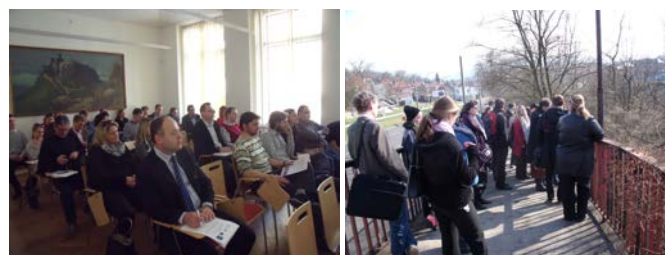
Exkurze CIVINETu do Ústí nad Labem, 19. 3. 2015