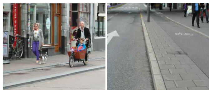
Obousměrná cyklostezka v Malmö a v Seville, chráněné různými způsoby oddělení od motorové dopravy